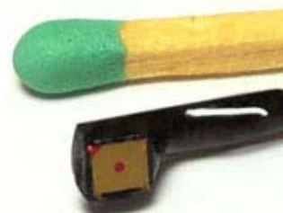
※ 写真はLED無しのタイプです。