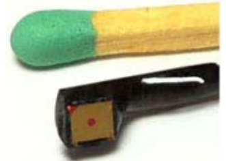
※写真はLED無しのタイプです。