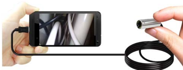
Micro USBタイプ MD-4010L-MU